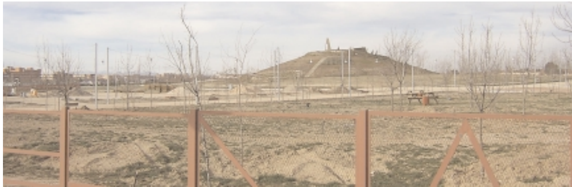
Parque Forestal de Valdebernardo