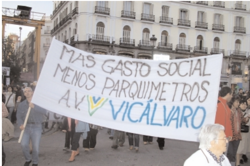
Pancarta de la Asociación de Vecinos de Vicálvaro en una de las manifestaciones contra los parquímetros en los barrios periféricos.