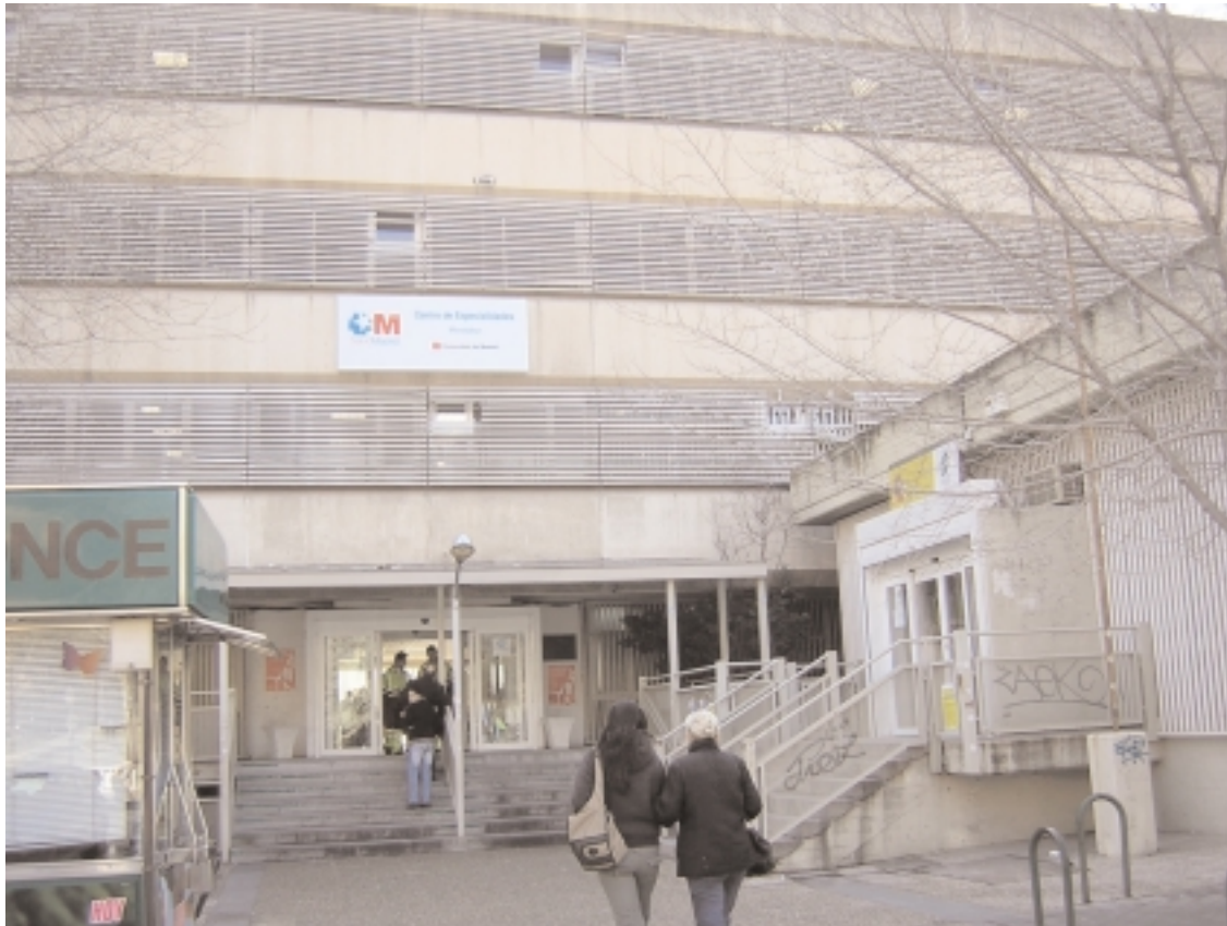
Ambulatorio o Centro de Especialidades de Moratalaz